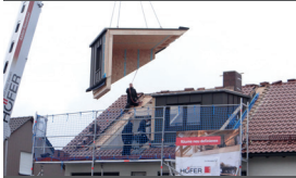
Vorfertigung aller Bauteile